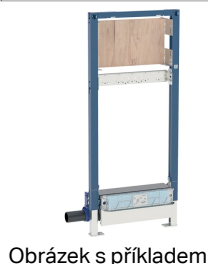
Obrázek s příkladem