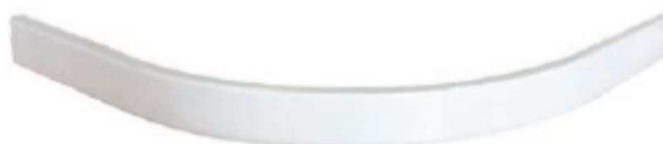
panel FLAT ROUND