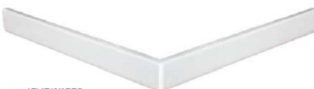
panel FLAT KVADRO