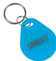
1 ks ze sady 50 ks žetonů SLZA 51B