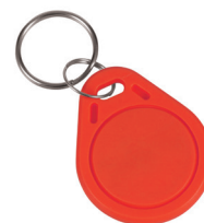
1 ks ze sady 50 ks žetonů SLZA 51R