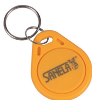
1 ks ze sady 50 ks žetonů SLZA 51