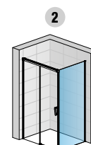
CAS2G + CAST