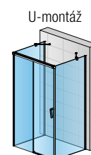
CAST + CAS2G + CAST + 2X RCA.XX

V případě objednávky U-montáže uvedte, že se jedná o U-montáž.