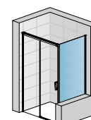
CAS2G + CASTSM